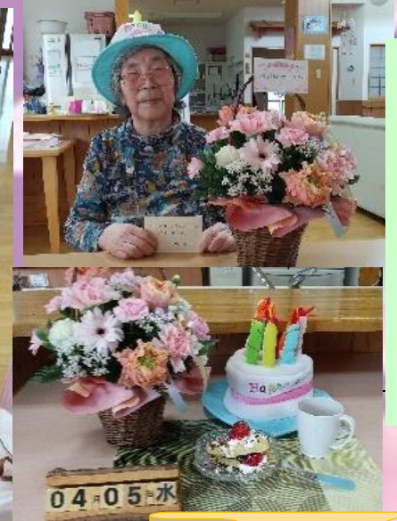
娘さんからお花が届きました。