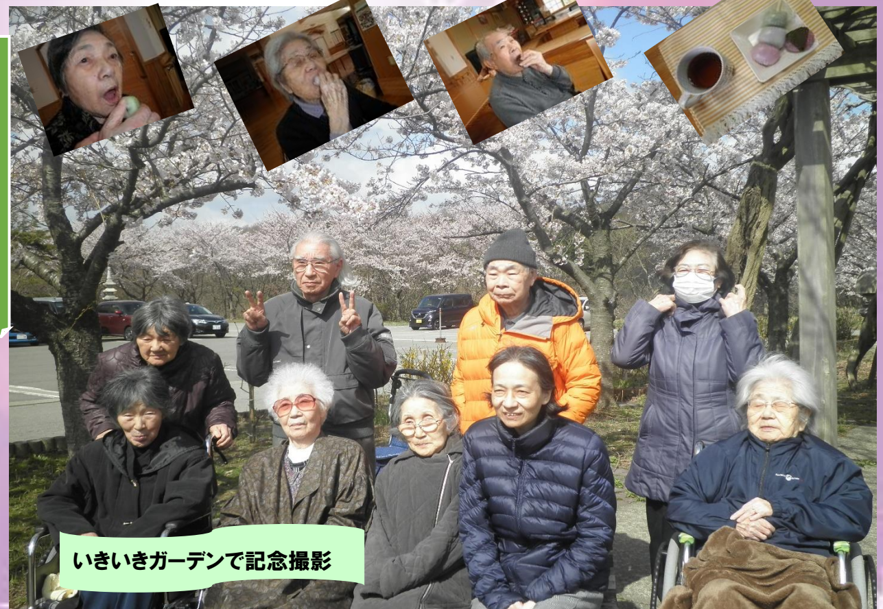
いきいきガーデンで記念撮影