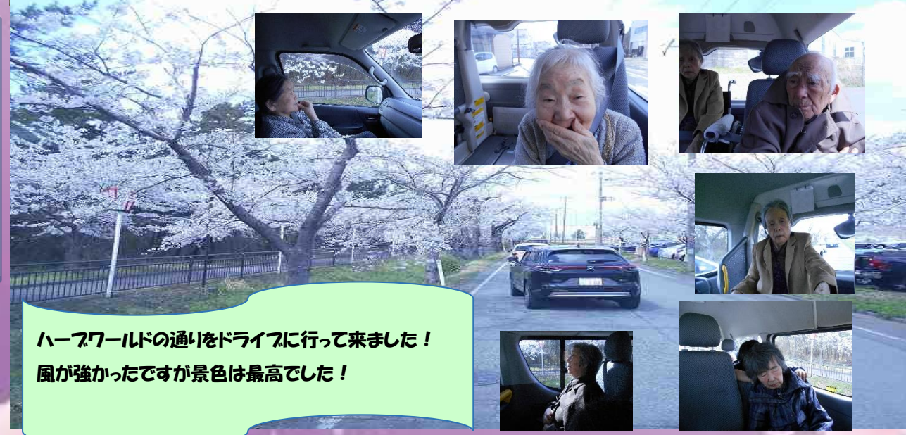
ハーフワールドの通りをドライブに行ってきました！ 風が強かったですが景色は最高でした！