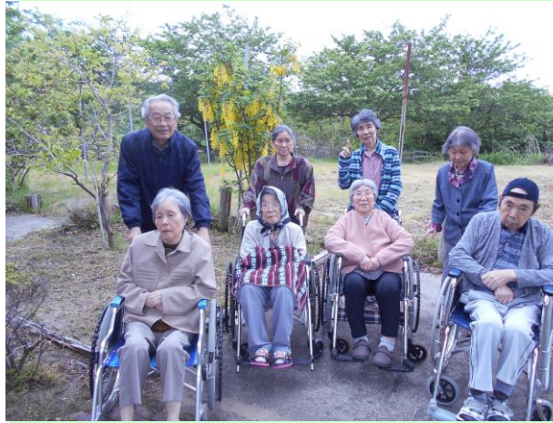
ピクニックでいきいきガーデンに行きました。藤の花がとてもきれいでした。