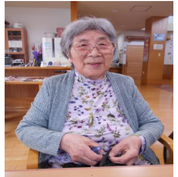
毛糸でアクリルたわしを作りました。