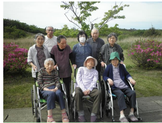
ひまわりの里の外周を散策しました。とても気持ち良かったです。