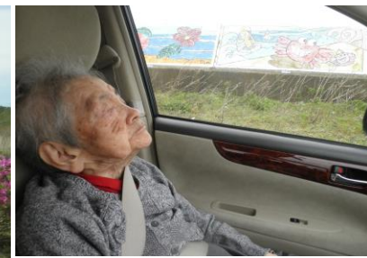
石脇、マリーナ方面にドライブに出掛けました。