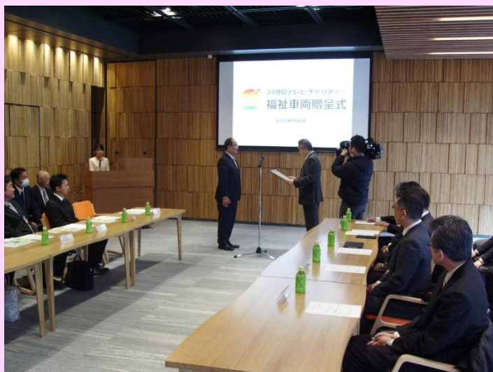
贈呈状授与の様子

24 時間テレビの寄附にご協力いただきました皆さまの趣意に添うよう、有効活用させていただきます。職員一同、心よりお礼申し上げます。